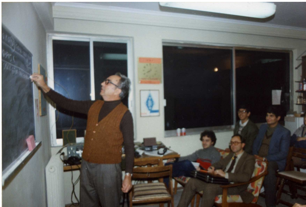
Ο SV2JJ με καινούργιο GROUP διδάσκει σήματα MORSE

Με μεγάλη χαρά και εκεί πού δεν το περιμέναμε βρέθηκαν ηλεκτρολόγοι πού δήλωσαν ότι είναι σε θέση να διδάξουν με αποσπασματικά μαθήματα, δηλαδή όχι συστηματικά από κάποια αρχή, αλλά σε ένα είδος διαλέξεων, θα ανέλυαν διάφορα βασικά, μαθήματα ηλεκτρολογίας.