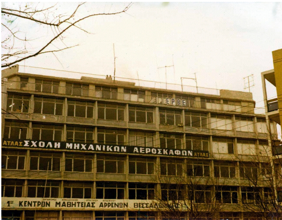
Τα γραφεία της ΕΡΒΕ στην οδό Λαγκαδά.

Η δεύτερη ήταν μία μεγάλη αίθουσα στον 6 ο όροφο κάτω από την ταράτσα. Στην πραγματικότητα ήταν δύο συνεχόμενα μεγάλα γραφεία. Έξω είχε τεράστια μπαλκόνια που έβλεπαν προς ανατολάς και βορρά και την άνοδο της οδού Λαγκαδά και κυρίως τα δωμάτια ενός ξενοδοχείου όπου σύχναζαν πολλοί Σκοπιανοί, πού τους ονομάζαμε ακόμη τότε Γιουγκοσλάβους, γιατί η Γιουγκοσλαβία του Τίτο ήταν ακέραια και σχετικά μονιασμένη.