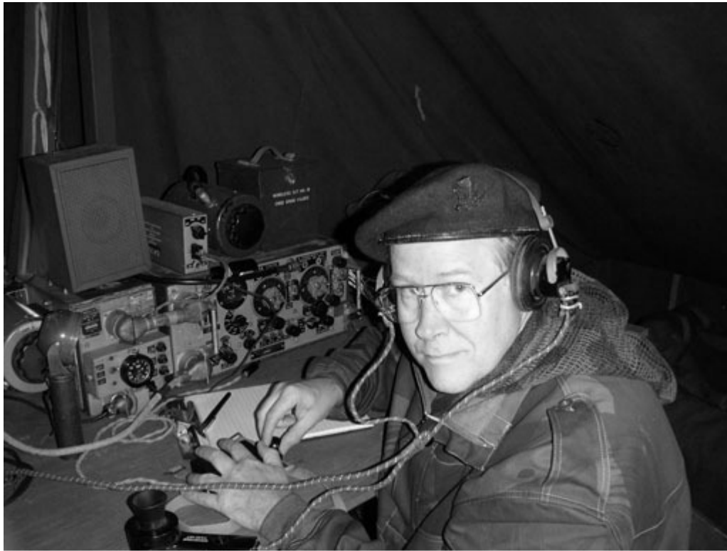
WS-19 operating in HQ of 1st Canadian Parashute Battalion, D-Day Normandy

θα αναφέρω ακόμη τον ασύρματο 19, πού παρείχε τρεις εξυπηρετήσεις. Μία για επαφή με την βάση, μία στο άρμα με άρμα, και μία για ενδοσυννενόηση για το πλήρωμα.